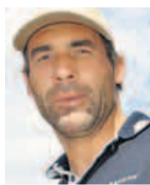
Abenteurer Horn lebt in der Schweiz

Die Yacht hat gerade einen Probeschlag von London bis Southampton hinter sich. Wer die „Pan-