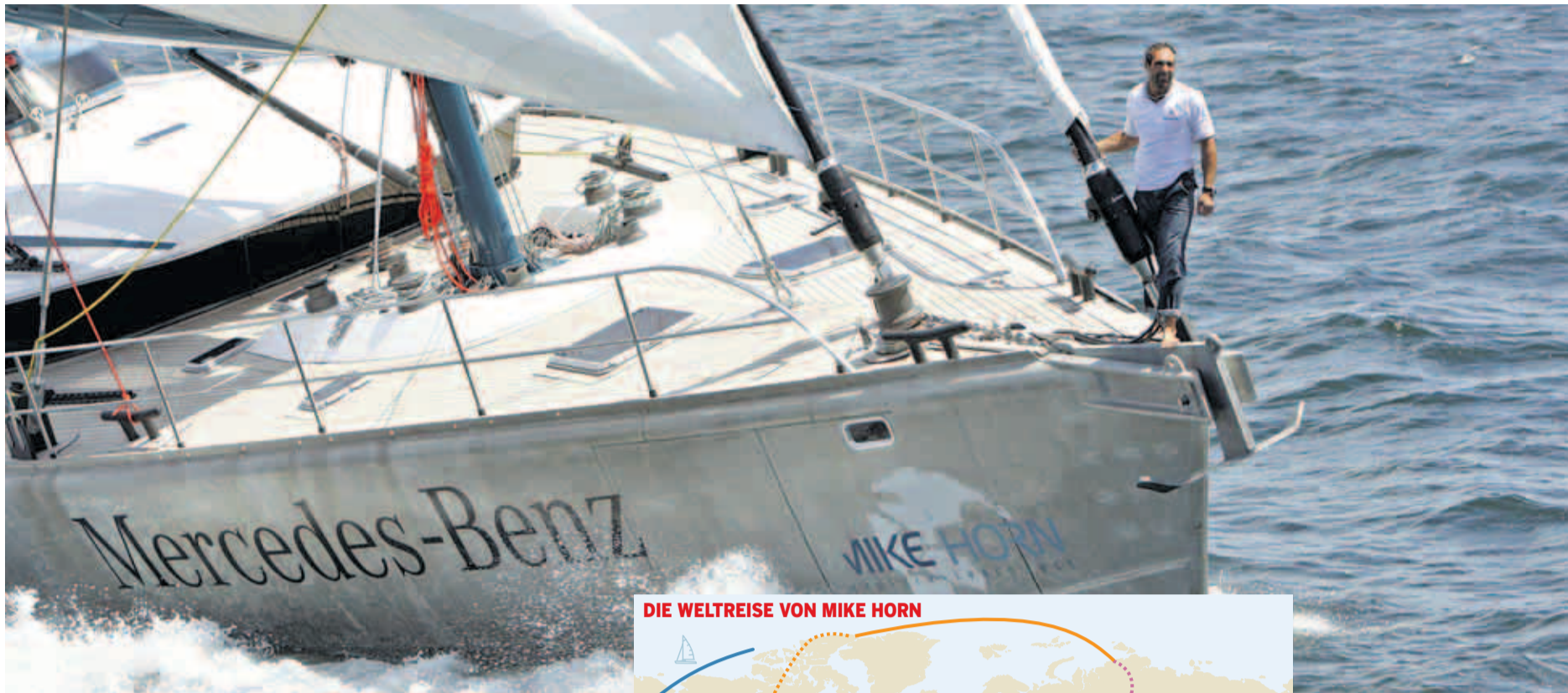
Mike Horn auf dem Steven der „Pangäa“, seiner riesigen Segelyacht

Der Begriff steht außerdem als Akronym für Pan Global Adventure for Environment Action – weltumspannendes Abenteuer für Umwelthandeln. „Es ist das aufregendste Projekt, das ich je unternommen habe“, sagt der Profiabenteurer. Im Mittelpunkt der mehr als 100 000 Kilometer langen Reise, während der Horn alle Kontinente und Meere durchmessen will, steht